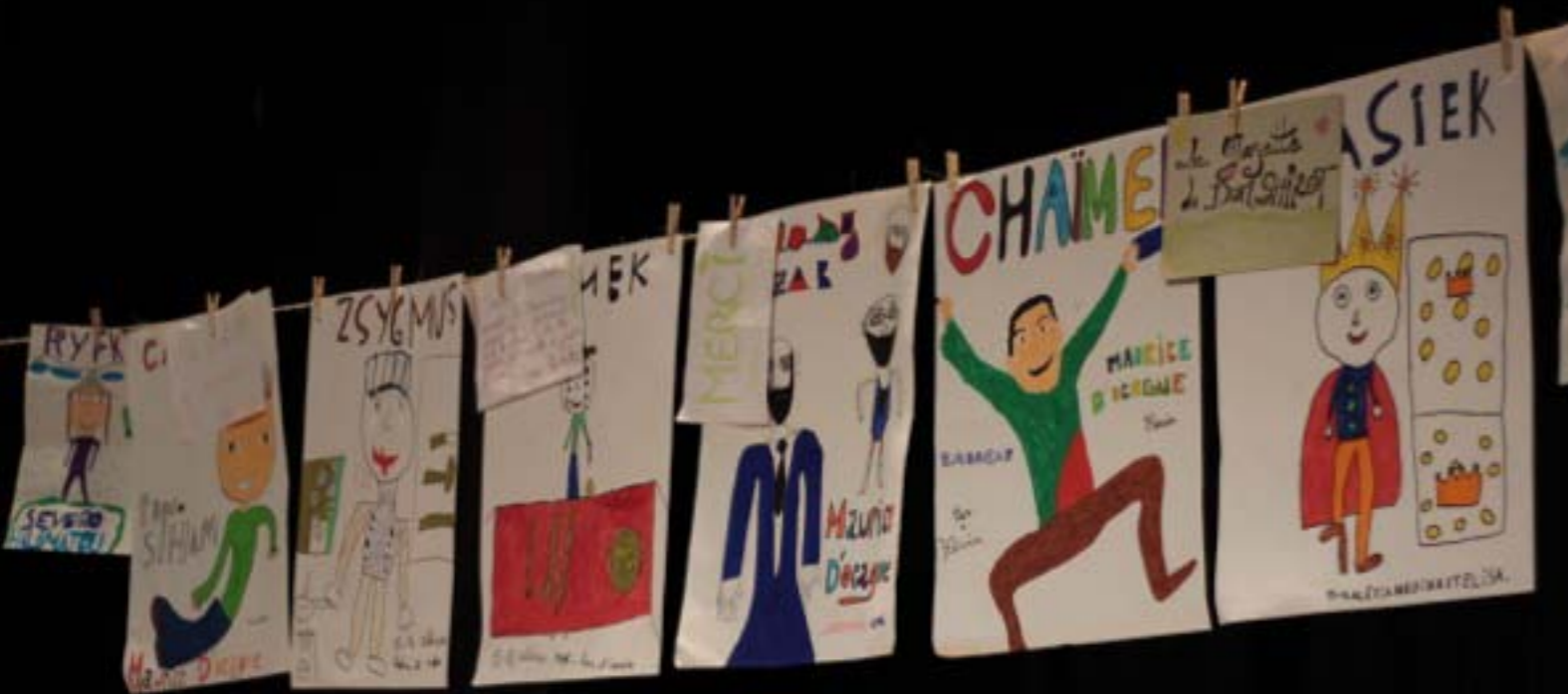
Janusz Korczak (1878-1942)

Il est considéré comme le père spirituel de la Convention Internationale des Droits de l'Enfant (CIDE), adoptée en 1989.